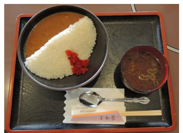
三州家が提供するダムカレー