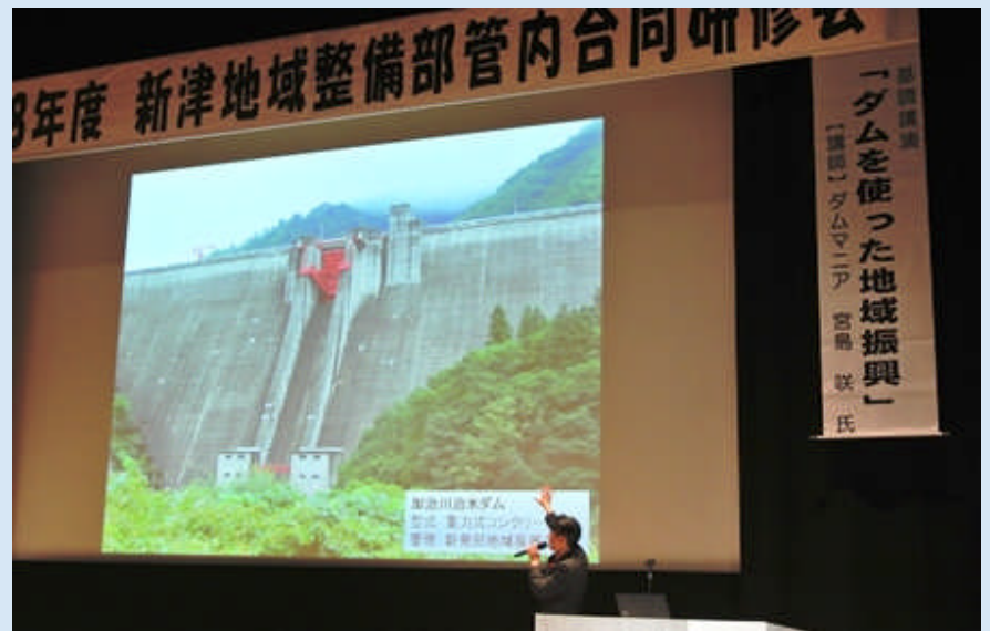
平成 28 年 11 月 9 日の講演の様子(引用:新潟県HP)

本業で提供しているダムを模したカレーは全国各地からダムファンが訪れる。群馬県みなかみ町や愛知県豊根村の地域おこしにダムカレーが活用されるなど、様々な角度からダムや水源地をプロモーションする事業を展開中。