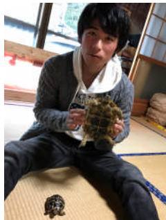
趣味の陸ガメ飼育