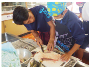
漁協青年部活動 (子供を対象としたお魚料理教室)