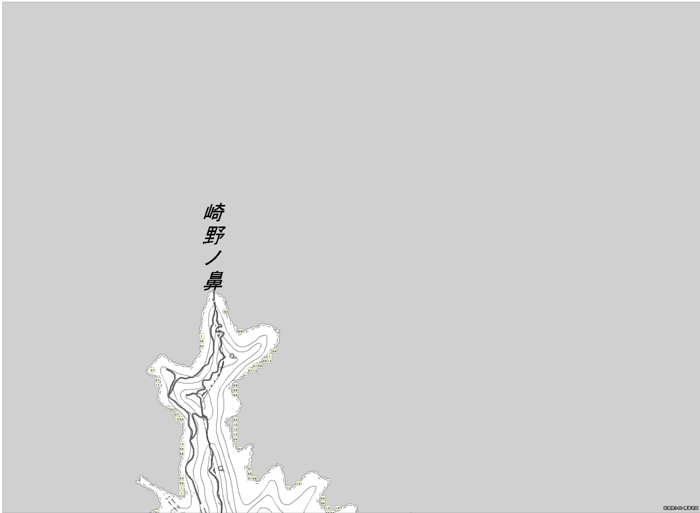
この地図は、国土地理院長の承認を得て、同院発行の電子地形図（タイル）を複製したものである。（承認番号 平 27 情複、第 1413 号） これをさらに複製又は使用して配付する場合には、国土地理院の長の承認を得なければなりません。