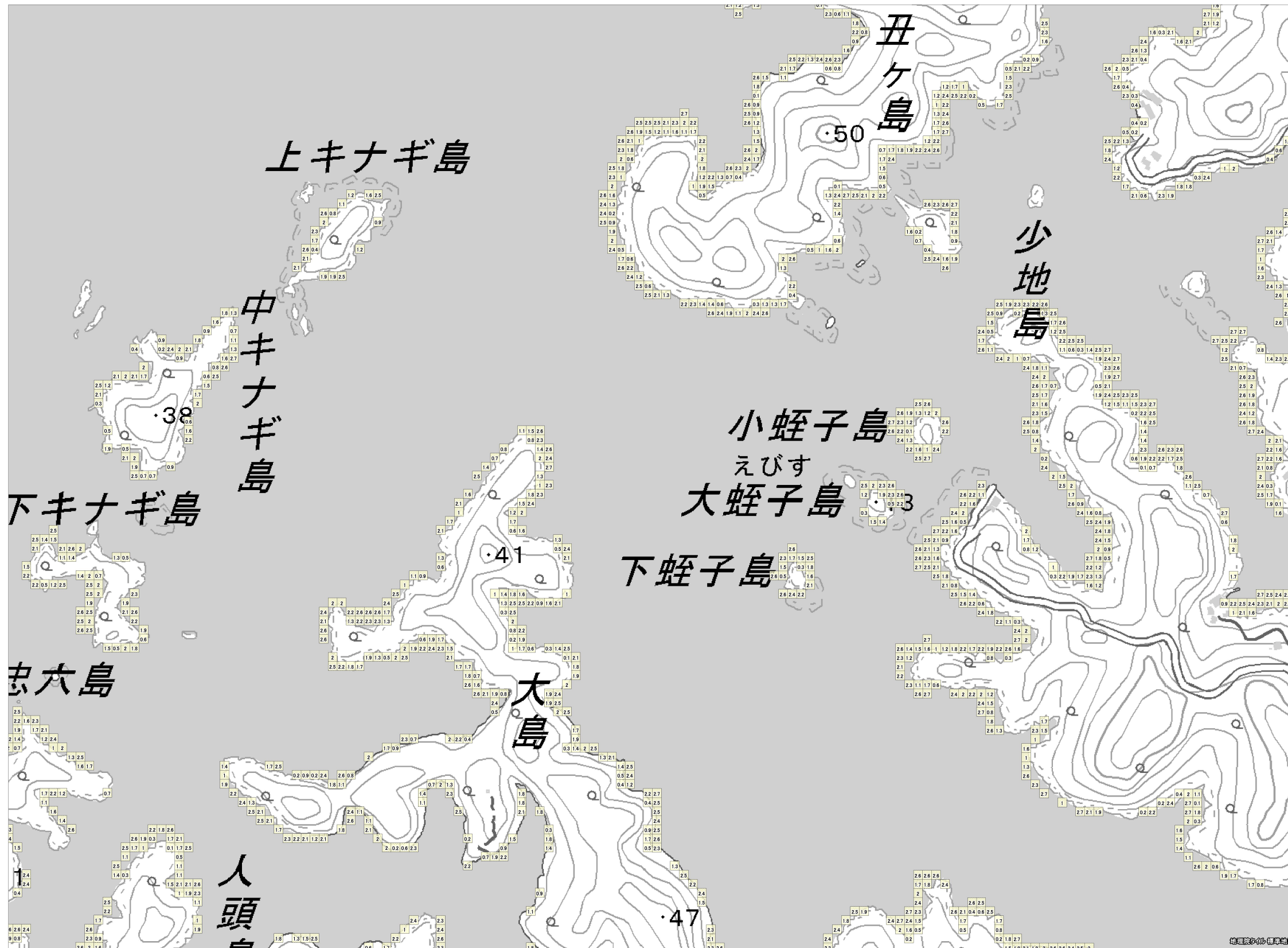
この地図は、国土地理院長の承認を得て、同院発行の電子地形図（タイル）を複製したものである。（承認番号 平 27 情複、第 1413 号） これをさらに複製又は使用して配付する場合には、国土地理院の長の承認を得なければなりません。