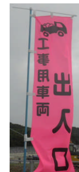
工事用車両出入口