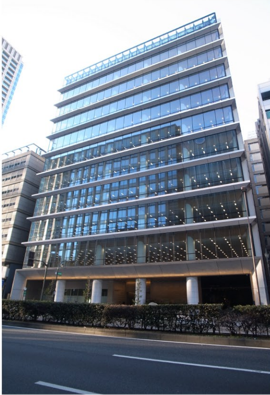
「日本橋 長崎館」の入っているアーバンネット日本橋二丁目ビル

3月7日、東京・日本橋にオープンした「日本橋 長崎館」。「首都圏と地元の人・物・情報の交流を活性化することで“地域を元気にする”」を基本コンセプトに、「定番」だけではない長崎の魅力を発信する新たな拠点です。