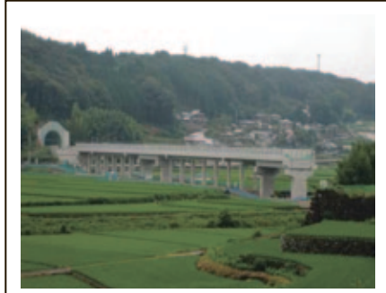
第1本明トンネル外1箇所他 本野高架橋 (H27.7撮影)