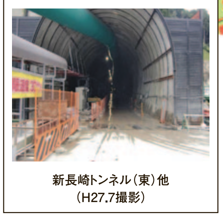
新長崎トンネル(東)他 (H27.7撮影)