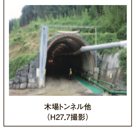
木場トンネル他 (H27.7撮影)