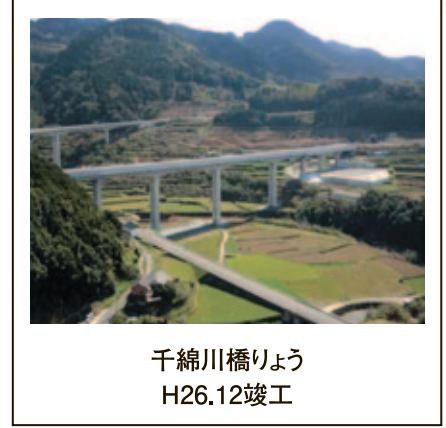
千綿川橋りょう H26.12竣工