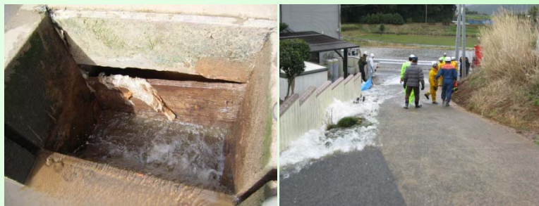
松板の老朽化による破損