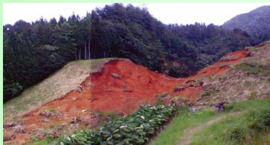
豪雨によるため池決壊例 (山口県)

また、近年、県内でも土砂吐の松板(水止板)が老朽化により破損し、ため池内の水が一気に下流域へ流れ出す事故が発生しています。