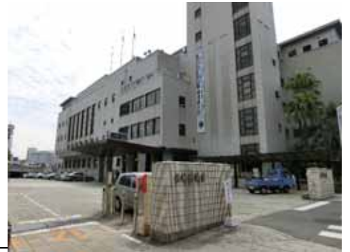
写真 - 27 <長崎県庁>

また、本区域は、 臨海部とまちなかを結ぶ位置にあるが、にぎわいの拠点となる施設や場所が少ない。