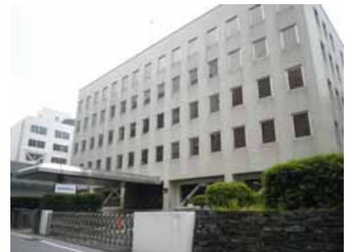
写真 - 28 <長崎地方裁判所>