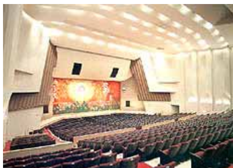
福江文化会館 客席ホール