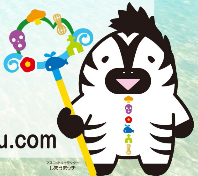
マスコットキャラクター しまうまっぴ