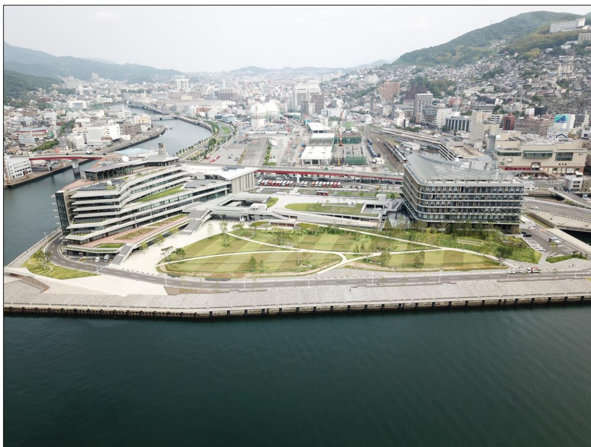
新県庁舎と防災緑地（尾上地区）

また、水揚げ機能の中心であった尾上地区は、旧来の荷捌用地前面を埋立て県庁舎用地と漁港施設用地を確保し、都心部の海際に住民の憩いの場とするとともに、長崎県地域防災計画における防災拠点港（H11.5 長崎県防災会議）として位置づけられていることから、災害発生時には、救援物資移送の大型貨物船等が係留可能な耐震強化岸壁（-5m岸壁（C）L=180m）やストックヤードとして使用できる防災緑地（約1.7ha）を整備し、平成30年1月供用を開始した。