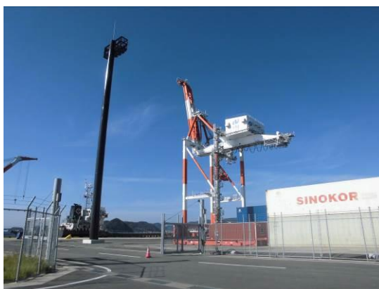
ガントリークレーン