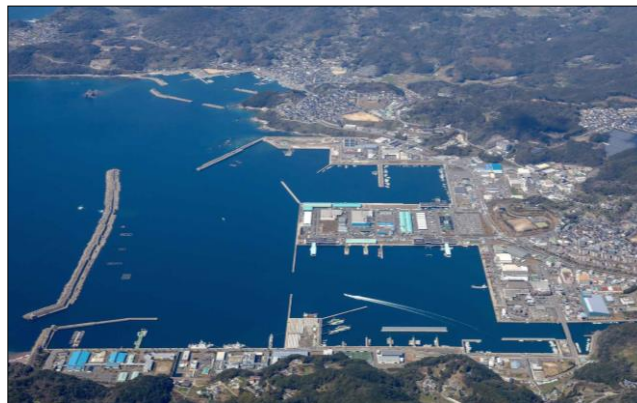
長崎漁港（三重地区）

長崎地区の漁港整備は、昭和23年から始まり昭和35年には特定第三種漁港指定を受けた。対岸の旭町、丸尾町といった漁港関連施設の整備を併せ昭和47年まで施設拡充が行われた。水揚げされた鮮魚は場内に引き込まれた国鉄の専用列車で関東方面まで運ばれるなど、高度経済成長期の日本を支えてきたが、施設の狭さが原因で取扱い能力の限界となったことから、三重地区に分区を計画し昭和48年から整備を開始した。