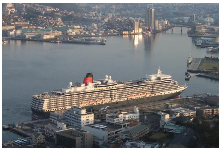
松が枝国際観光船埠頭とクイーン・エリザベス（松が枝地区）

漁港は、特定第3種漁港の長崎漁港（長崎地区と三重地区）及び第2種漁港の式見、野母、樺島の3漁港がある。