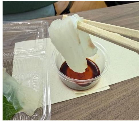
学校養殖ヒラメの試食