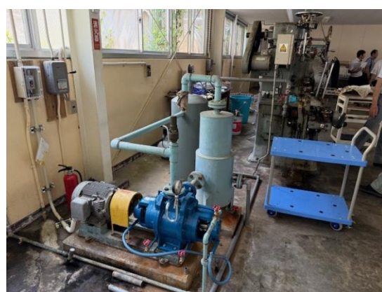
施設見学（缶詰製造）