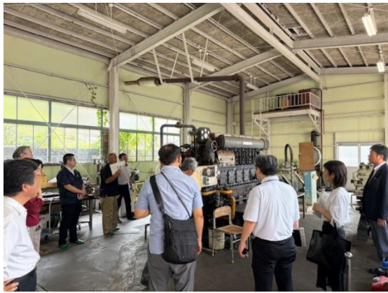
施設見学（エンジンの構造）