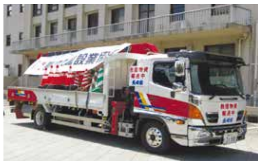
県建設業協会・県鉄筋工業協同組合の協力を得て、カラーコーンなど保安用資材を被災地に搬送しました。