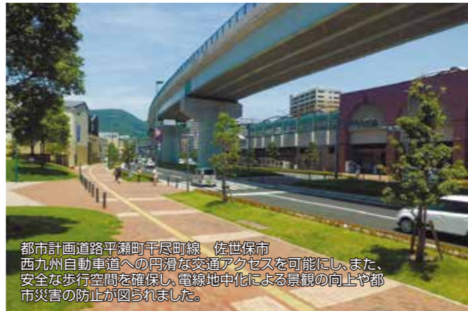
都市計画道路平瀬町千尺町線 佐世保市 西九州自動車道への円滑な交通アクセスを可能にし、また、安全な歩行空間を確保し、電線地中化による景観の向上や都市災害の防止が図られました。