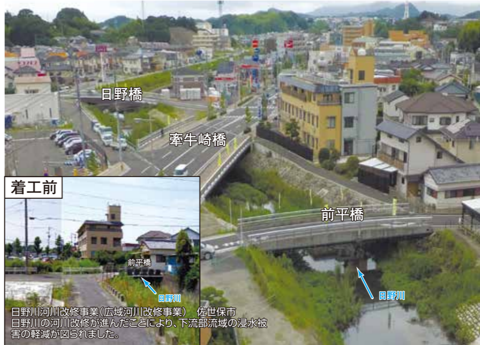
日野川河川改修事業(広域河川改修事業) 佐世保市 日野川の河川改修が進んだことにより、下流部流域の浸水被害の軽減が図られました。