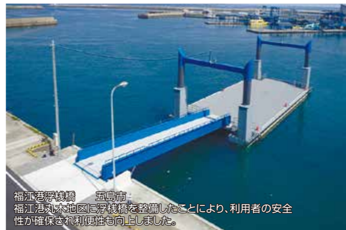
福江港浮桟橋 五島市 福江港丸木地区に浮桟橋を整備したことにより、利用者の安全性が確保され利便性も向上しました。