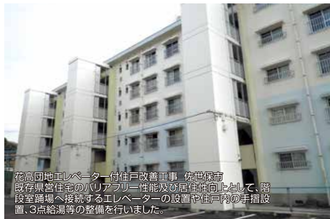
花高団地エレベーター付住戸改善工事 佐世保市 既存県営住宅のバリアフリー性能及び居住性向上として、階段室踊場へ接続するエレベーターの設置や住戸内の手摺設置、3点給湯等の整備を行いました。