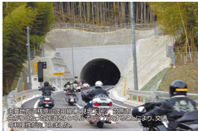
主要地方道嵯原小茂田線(上見坂工区) 対馬市 曲がりくねった峠道をトンネルでバイパスすることにより、交通の利便性が向上しました。