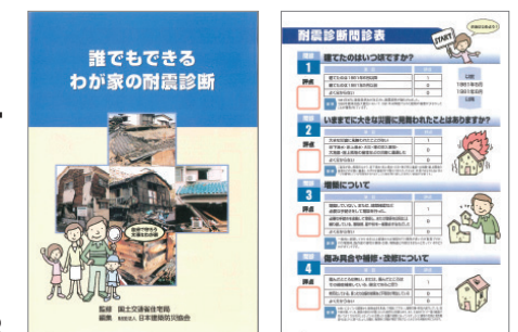
「誰でもできるわが家の耐震診断」 （住宅の所有者が行う簡易診断） 提供：（一財）日本建築防災協会