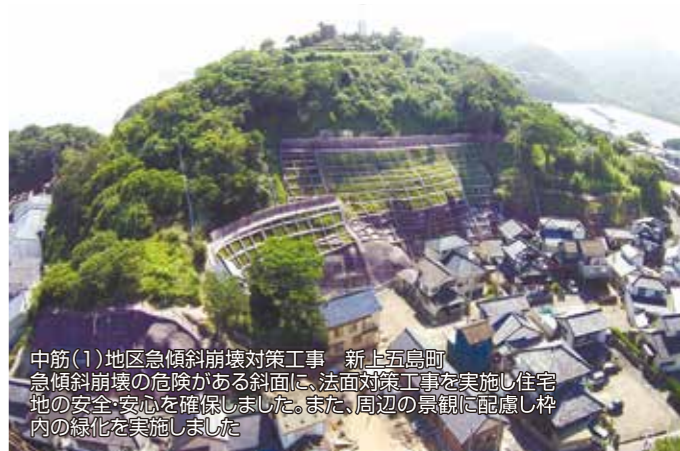
中筋(1)地区急傾斜崩壊対策工事 新上五島町 急傾斜崩壊の危険がある斜面に、法面対策工事を実施し住宅地の安全・安心を確保しました。また、周辺の景観に配慮し柵内の緑化を実施しました。