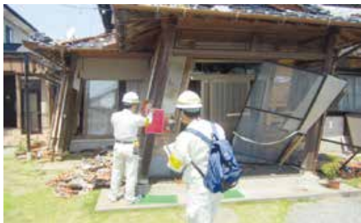
被災建築物応急危険度判定の様子。判定ステッカーを見えやすい場所に表示しました。