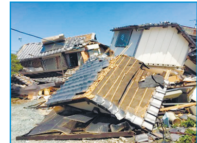
倒壊した建築物（益城町）

耐震性が不足している建物は耐震改修の実施により、大地震による被害を大幅に軽減することが可能となります。