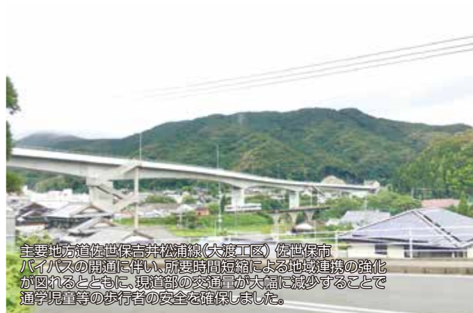
主要地方道佐世保吉井松浦線(大渡工区) 佐世保市 バイパスの開通に伴い、所要時間短縮による地域連携の強化が図れるとともに、現道部の交通量が大幅に減少することで通学児童等の歩行者の安全を確保しました。