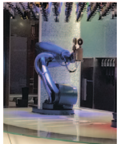
カクテルを作るロボット 「バイオニック・バー」

同船は昨年11月に就航したばかりの新船で、地上約90mの眺望を楽しめる展望カプセル「ノース・スター」やスカイダイビングを疑似体験できるアトラクションの他、タブレット端末で注文するとロボットがカクテルを作ってくれるなど、最新鋭のシステムが多く取り入れられています。