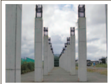
竹松高架橋他 (H27.7撮影)

※長崎県内約49.2kmのうち、約95%となる約45.9kmが発注済となっています。 ※鈴田トンネル他及び千綿川橋りょう(青字)については工事が竣工しています。