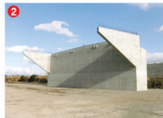
2 工事名 一般国道251号橋梁整備工事(宮添高架橋A2) 施工者 ㈱有馬 技術者 本多 豊次 工事内容 橋の橋台を新設する工事です。