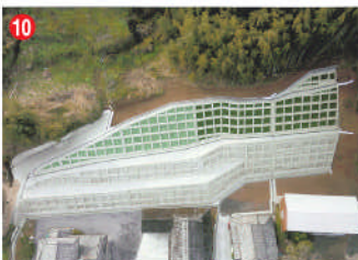
10 工事名 石崎(2)地区急傾斜地崩壊対策工事 施工者 ㈱豊恒 技術者 川野 雄輔 工事内容 げけの崩壊を防止する工事です。