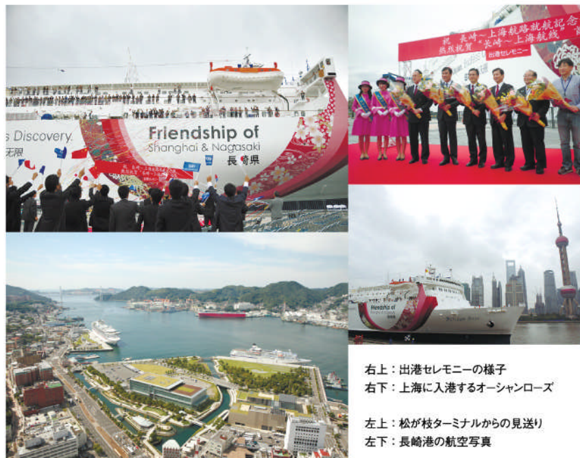
右上：出港セレモニーの様子 右下：上海に入港するオーシャンローズ