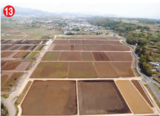
13 工事名 牟田地区区画整理工事(1-2工区) 施工者 本間建設㈱ 技術者 古里 初則 工事内容 水田の区画を整える工事です。