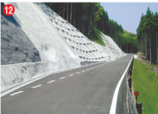
12 工事名 西彼半島線森林基幹道開設工事(小松工区) 施工者 ㈱進成 技術者 川谷 裕輔 工事内容 林道を新設する工事です。