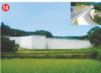
14 工事名 一般国道383号道路改良工事(1工区) 施工者 平戸建設㈱ 技術者 川本 豊二 工事内容 道路を補強・拡幅する工事です。