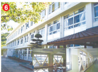
6 工事名 奈留高校管理教室棟耐震改修(2期)工事 施工者 ㈱才津組 技術者 村里 重則 工事内容 高校校舎の耐震化工事です。