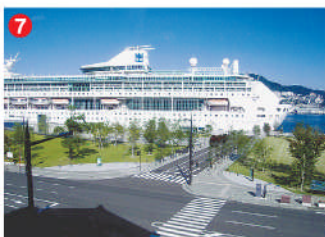
7 工事名 長崎港松が枝国際観光船舶頭整備工事(道路A) 施工者 ㈱西海建設 技術者 小川 一貴 工事内容 松が枝国際観光船舶頭のアクセス道路を造る工事です。