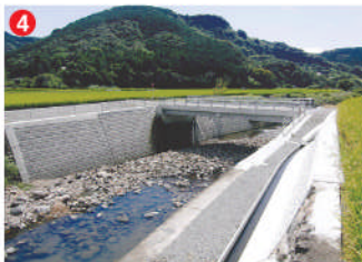
4 工事名 川棚川河川改修工事(上石木橋) 施工者 ㈱西部工建 技術者 山田 賢次 工事内容 河川の拡幅に伴う橋の架替え工事です。