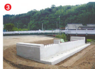
3 工事名 主要地方道小浜北有馬線交通安全施設等整備工事(西正寺橋A2) 施工者 宅島建設㈱ 技術者 高橋 勇樹 工事内容 橋の橋台を新設する工事です。