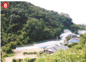
8 工事名 宮ノ前(1)地区急傾斜地崩壊対策工事 施工者 ㈱法面 技術者 藤田 浩之 工事内容 げけの崩壊を防止する工事です。