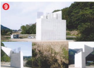
9 工事名 主要地方道佐世保吉井松浦線橋梁整備工事(大滝高架橋A2) 施工者 ㈱協和土建 技術者 石原 洋 工事内容 橋の橋台を新設する工事です。