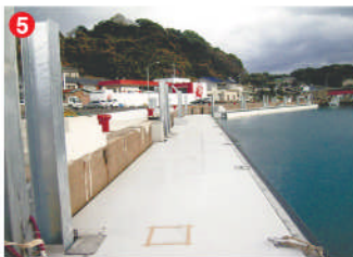
5 工事名 芦辺地区広域漁港整備工事(1工区) 施工者 ㈱岡本組 技術者 濱口 史広 工事内容 浮桟橋を設置する工事です。