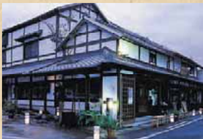
猪原金物店(島原市)