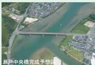
瀬戸中央橋完成予想図