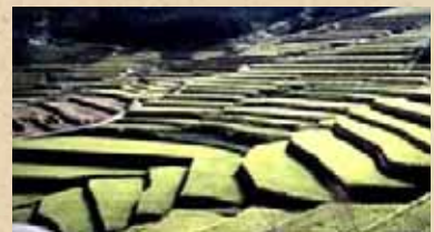
鬼木棚田と集落(波佐見町)

美しいまちづくりホームページ http://www.pref.nagasaki.jp/beautiful/ お問い合わせ◎まちづくり推進局 景観まちづくり室 ☎095-894-3151 FAX095-894-3462 ✉s08510@pref.nagasaki.lg.jp