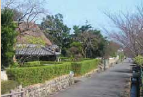
神代小路のまちなみ(雲仙市)