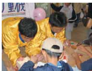
おもちゃの建設機械