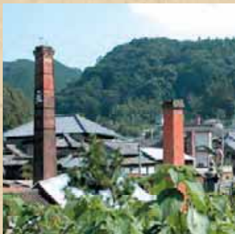
三川内山のまちなみ(佐世保市)

ま ちなみの風景は、子供の頃と比べてどう変わりましたか。以前は県内には特徴的な「まちなみ」が数多くありましたが、経済性の優先などから個性に欠けた「まちなみ」が増えつつあります。県では、住んでいる人が誇りと愛着を持ち、外部の人が訪れてみたいと思えるような「まちなみ」にするために、平成15年度から「美しいまちづくり推進事業」に取り組んでいます。