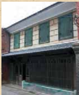
旧松本薬局(壱岐市)