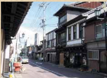
平戸城下旧町のまちなみ(平戸市)