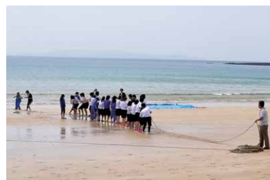
② 후릿그룹 고기잡이

농사 체험, 어업 체험 등 다양한 장소에서 체험합니다. 클래스 단위나 그룹 단위로 체험이 가능하며, 원하는 체험 내용을 선택하실 수 있습니다.