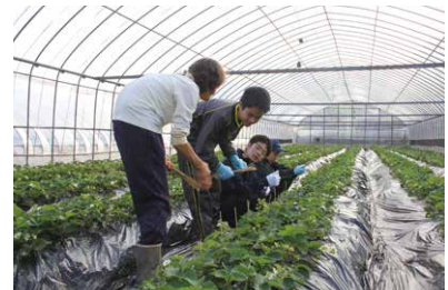
① 딸기 손질 작업