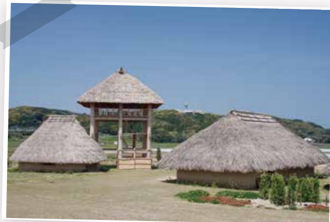
一支国王都復元公園