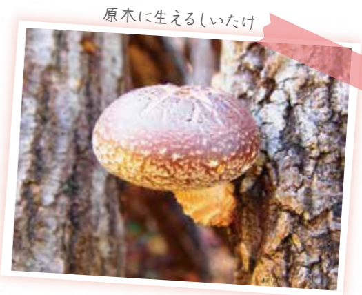
原木に生えるしいたけ

対馬は約90%が森林ですが、森の中で栽培する原木しいたけは肉厚で特産品となっています。また、国内の養蜂で利用されているミツバチは、ほとんどがセイウミツバチですが、対馬ではニホンミツバチの貴重なはちみつが作られています。また、原種に近く小粒で香り強い対州そばが守り育てられており、人々に親しまれています。また、さつまいもを発酵させたせん団子を使った麵状のろくべえなど独特の食文化が残っています。さらに、対馬海流の恵みである魚介類が豊富に取れるほか、特産のたたきいかの製造過程ではイカをメリーゴーランドのような機械で回転・乾燥させる珍景が見られます。