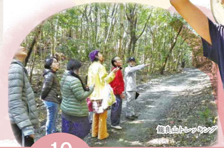
龍良山トレッキング