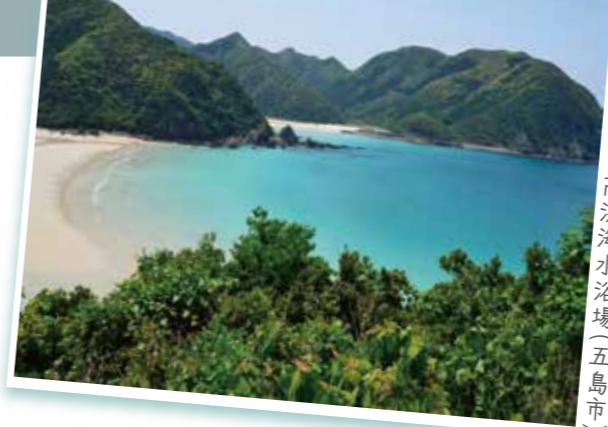
高浜海水浴場(五島市)