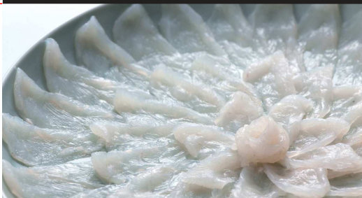
⑥なほぶく / 獲海域を限定して販売許可措置がとられている唯一のぶく。島原地方ではぶくは「がんば」と呼ばれ親しまれている。