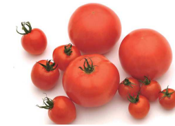
⑩トマト / 「原城トマト」は普通のトマトに比べて小振りだが、まるでフルーツのような驚きの甘みを感じる。

Asparagus". ⑧Setsumezaki/During the spring tide which happens from March to June, you can watch the majestic 20 meter whirling tides. It's also a good spot for fishing. ⑨Tomato/The "Hara Castle Tomato" is small compared to the average tomato but it can boast of having a surprising amount of sweetness. ⑩Tomato/"Hara Castle Tomato" is small compared to the average tomato but it can boast of having a surprising amount of sweetness.