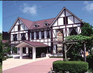
⑤雲仙ビードロ美術館。19世紀のポセアンガラス、オイルランプを中心に日本のビードロや陶磁器が展示されておりビードロ作り体験もできる。