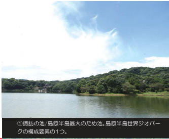
①環状の池 / 島原半島最大のため池。島原半島世界ジオパークの構成要素の1つ。