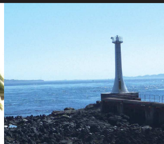
⑧瀬崎(セツメザキ) / 3～6月の大潮期には、蒸流の早さが増し、直径20mの湧きあがりが見られる。釣りポイントでもある。

①Suwa Pond/The pond is the largest in the Shimabara Peninsula. It is one of the elements that make up the Shimabara Peninsula world Geopark. ②Unzen Jigoku(Hell Hot Spring)/With its high temperature, dreadful spewing of fumes smelling of sulfur compounds and billowing white smoke, this spring is a picture of Hell itself. ③Tanada Observatory/From this observatory guests can see beautiful terraced rice fields which were selected in the top 100 terraced rice fields of Japan. ④Tani no Kaki/White puffer is a 100-year-old specialty of Unzen. It is made from a special kind of puffer fish caught in the sea near Unzen. It is a delicacy that is loved by many people.