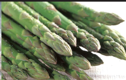
⑦アスパラガス / 長崎県島原のアスパラガスの頂点を極める「王様アスパラ」は絶品。