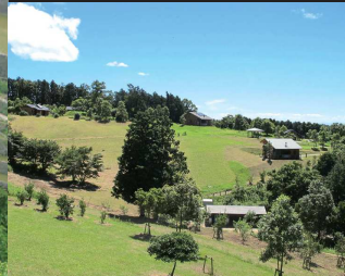
④エコパーク納所原「自然環境型社会」がテーマの体験型エコパーク。オートキャンプ場、体験型自然食レストランを利用できる。