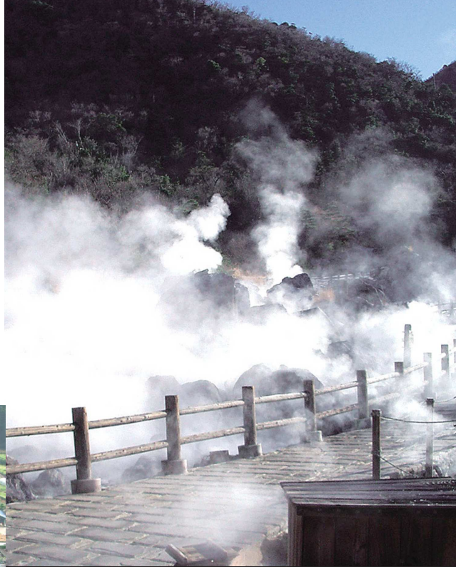
②雲仙地獄 / 高温の温泉と噴気が激しく噴出し、硫黄化合物の臭いが漂う中、白い煙がもくもくと立ち上るさまはまさに地獄そのもの。

【Course Guide】 Guests will travel from Kuchinotsu Port on the Shimabara Peninsula, passing through Suwa Pond and a bountiful plateau where ancient peoples lived, and reach the Unzen Hot Springs area beyond the 881 meter tall Mt. Takaiva. The history of the earth can be felt through the Shimabara Peninsula Geopark in Hayasaki, which is the first of its kind in Japan. Around the Unzen Spa Town area there are many exciting spots like the Unzen-Amakusa National Park Visitor's Center as well as the ceaselessly steaming Jigoku Hot Springs or "Unzen Hell".