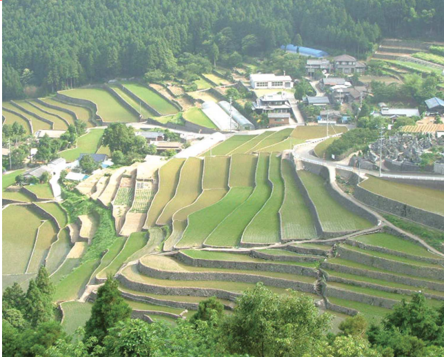
③棚田展望台 / 日本棚田百選に選定された石積の美しい棚田が望観できる。