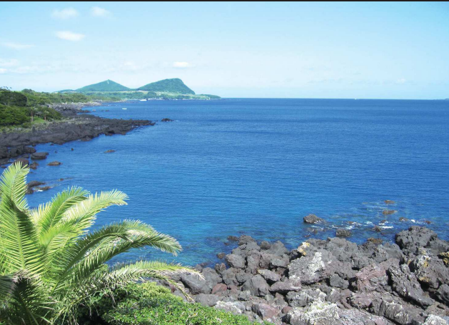
④釜淵岩海岸/変化に富んだ海岸線を形作り、至る所に亜熱帯植物が繁茂し、美しい景観を呈している。