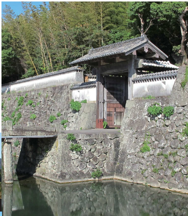
③福江城/五島藩主居城跡。黒船来航に備え築城した江戸幕府最後の日本で最も新しい城。