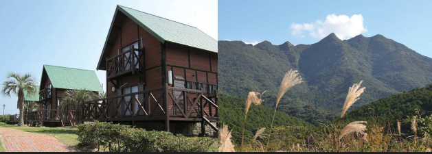
①さんさん福江キャンプ村/テニス・海水浴などアウトドアスポーツも楽しめるキャンプ地。

On this course guests will get their fill of history, grassland, sandy beaches, and hot springs. After walking Bukeyashiki Street which exhibits characteristics from the Edo Period, guests climb Mt. Onidake where they can see whole island laid out in 360 degrees around them. From there guests trek up Mt.Nanatsudake and Mt.Tetegadake and finish at the Arakawa hot spring.