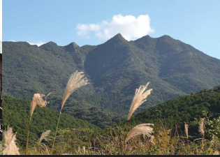
②七ツ岳/標高は432mあり、九州百名山の一つ。山頂からの360°の眺めは絶景。