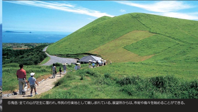
⑤鬼岳/全ての山が芝生に覆われ、市民の行楽地として親しまれている。展望所からは、市街や島々を眺めることができる。