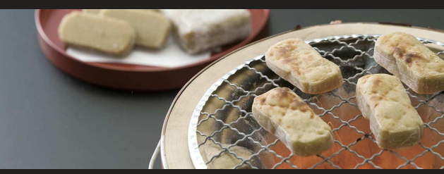
⑥かんころ餅/かんころ餅発祥の地である五島列島、さつまいもの優しい甘みと素朴な味わいが楽しめる。