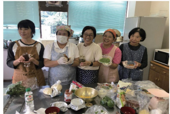
(JAごとう女性部の皆様)