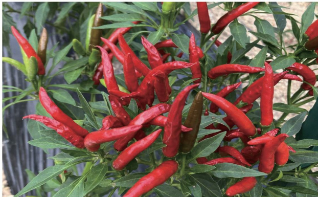
(新上五島町のとうがらし)

新上五島町では平成27年から、高齢者でも栽培しやすい軽量・高単価な品目として、とうがらしの栽培が行われています。さらに、高付加価値化や栽培意欲向上を目的として加工品開発にも取り組んでおり、振興局ではこれまでに、JA・地元企業と連携して「唐辛子五島うどん」等の開発を支援してきました。令和6年度からは、JA ごとう女性部と連携し、島内販売用の唐辛子味噌や甘夏胡椒等の開発、JAごとうの紹介による加工業者と連携したラー油開発に取り組んでいます。今後は試作品の試食やアンケート調査を実施し、加工品の絞り込みや商品化に向けた改善を行う予定です。