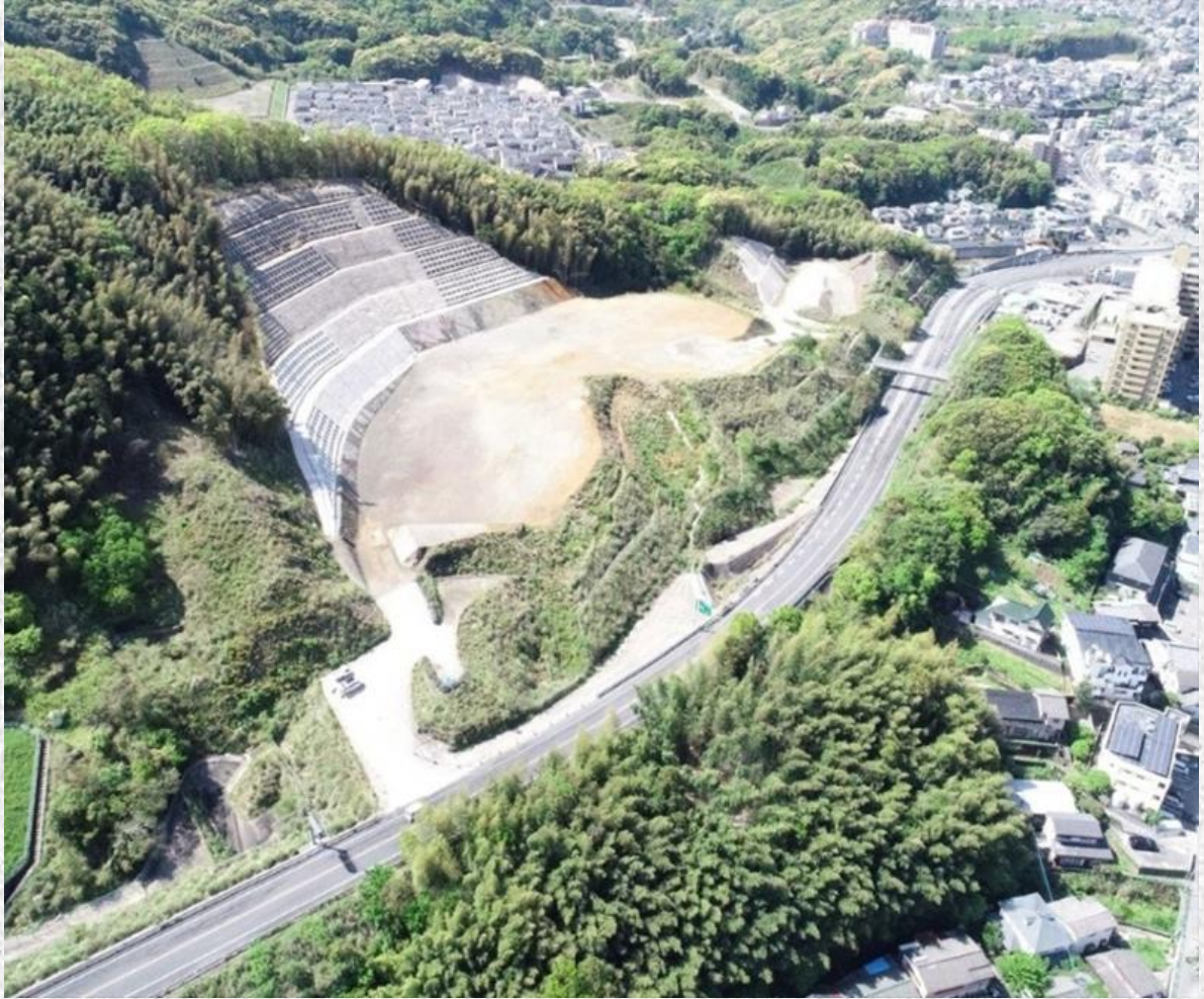
主要地方道長崎南環状線道路改良工事（新戸町～江川町工区）