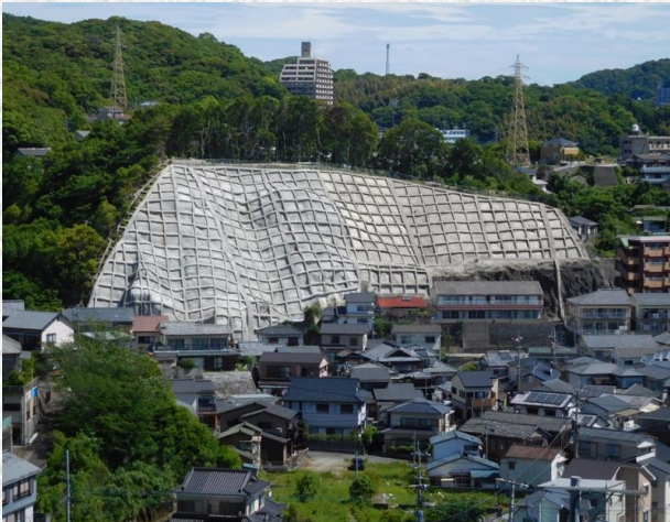
金堀(1)地区急傾斜地崩壊対策工事