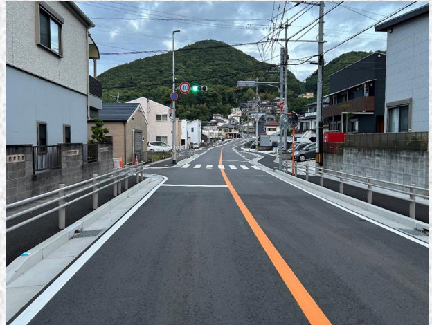
国道202号交通安全施設等整備工事 （福田本町工区）