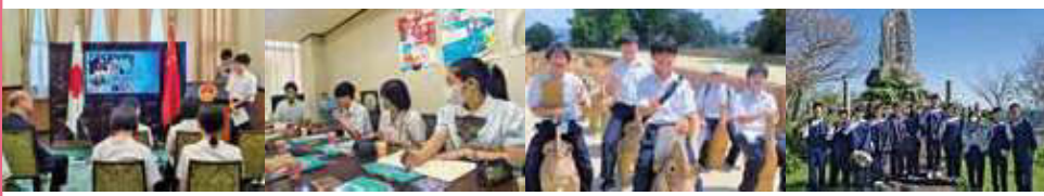
中国駐長崎総領事館訪問