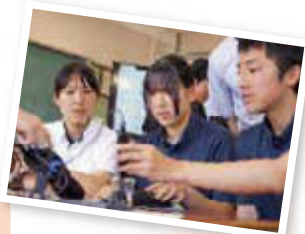
堀場アドバンステクノ [DX機器を用いた水質測定]