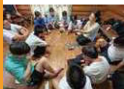
イングリッシュキャンプ