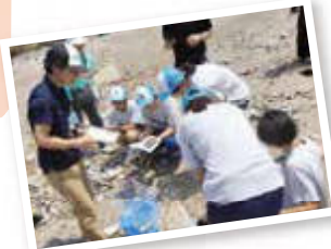
九十九島水族館海きらら [海洋生物採集とその同定]