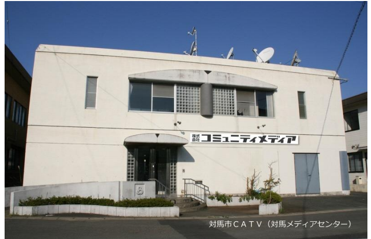
対馬市CATV (対馬メディアセンター)