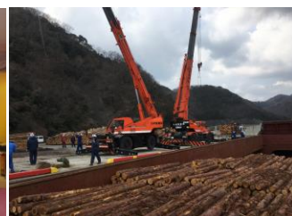
左：令和6年10月創立50周年記念 右：対馬産ヒノキ材積み込み作業