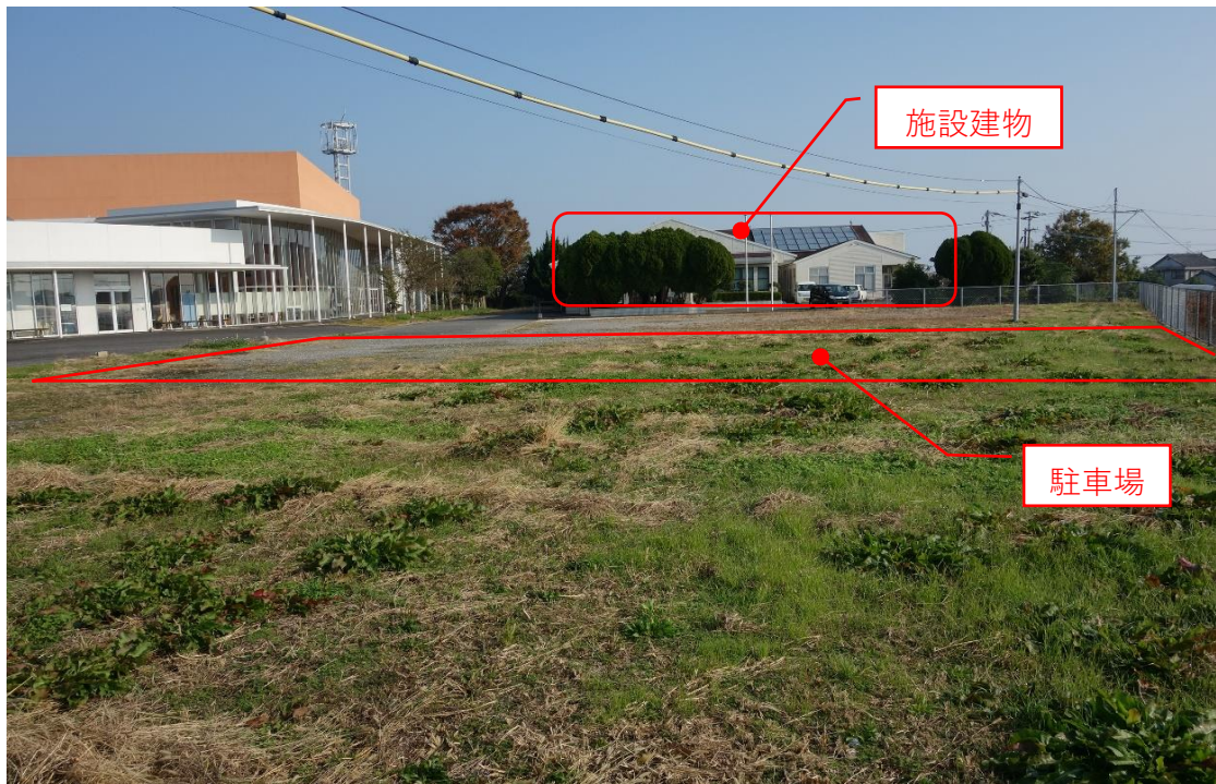
図3 作業場・駐車場近景