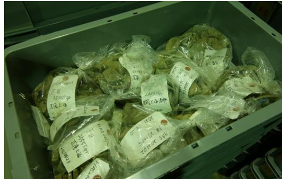
未水洗遺物収納コンテナ内状況