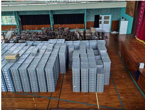
遺物保管状況 (佐世保市収蔵庫)