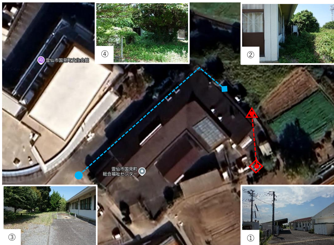
図4 電力・水道引き込みルート

(赤:電力(◇①既設電柱・△②仮設建柱)、青:水道(○③メーター分岐・◇④蛇口))