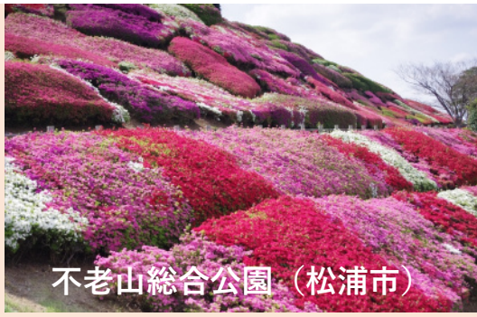
不老山総合公園（松浦市）