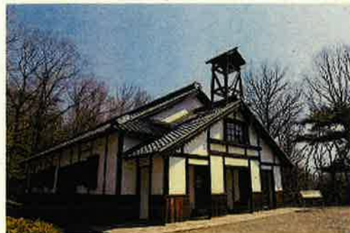
大明寺教会 (伊王島から明治村へ)