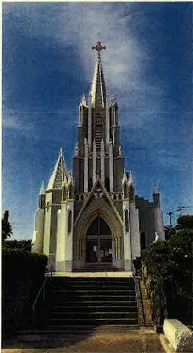
平戸ザビエル記念教会