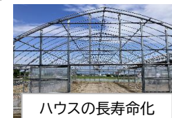
ハウスの長寿命化