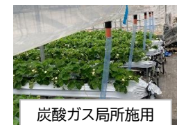
炭酸ガス局所施用