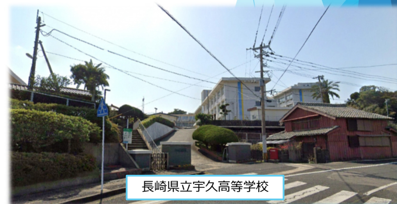
長崎県立宇久高等学校