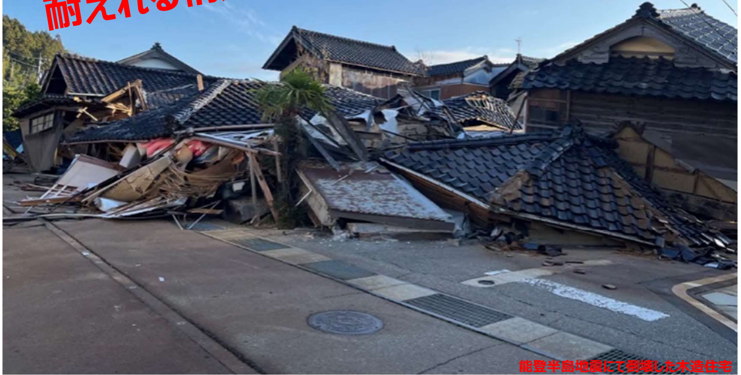
能登半島地震にて倒壊した木造住宅