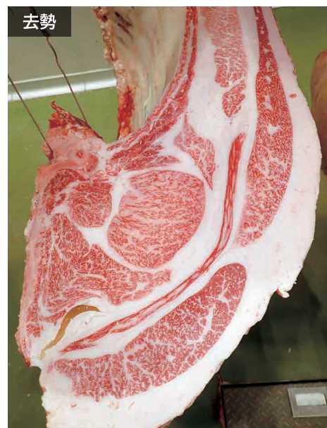
母の父/平茂晴 BMS. No. 11 母の祖父/勝21 ロース芯 70cm 2