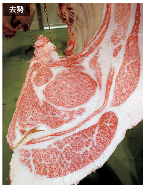
母の父/平茂晴 BMS. No. 12 母の祖父/安平 ロース芯 79cm 2