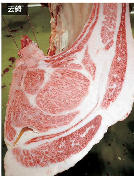
母の父/平茂晴 BMS. No. 12 母の祖父/安福久 ロース芯 85cm 2