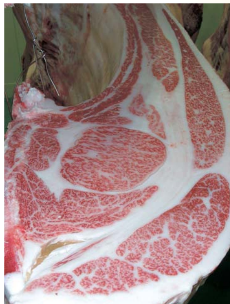
母の父/福之国 BMS. No. 10 母の祖父/安平 ロース芯 66cm 2