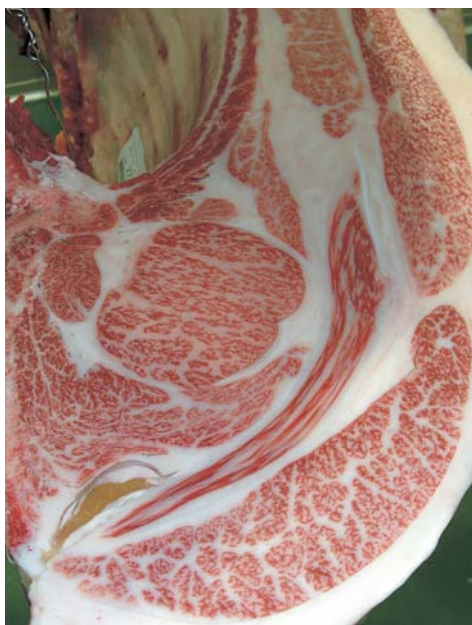
母の父/平茂晴 BMS. No. 10 母の祖父/安平 ロース芯 66cm 2