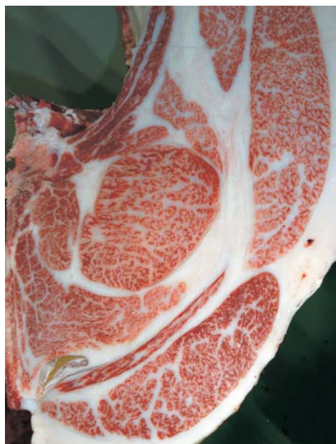
母の父/福之国 BMS. No. 11 母の祖父/安平 ロース芯 95cm 2