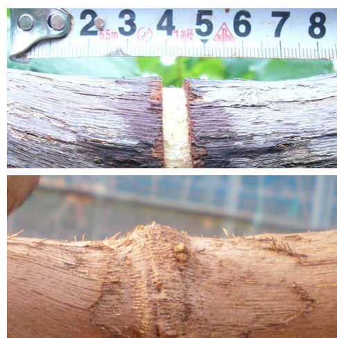
図2 環状剥皮処理直後の枝(上)と完全に癒合した冬季の状況(下)