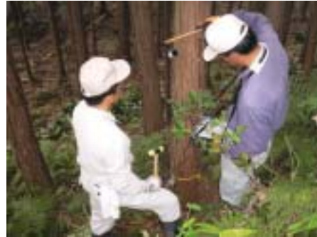
図1 立木強度の計測状況