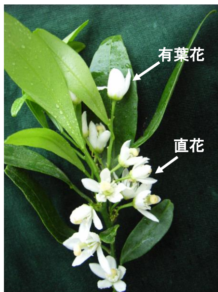
写真1 「麗紅」の有葉花と直花

果樹研究部門内の同一ハウス内に植栽した少加温栽培の10年生「せとか」および8年生「麗紅」を供試し、開花前の2006年4月14日にそれぞれの品種の3~4年生の側枝を無作為に5本ずつ選び、有葉花と直花に分けて着花数を調査した。生理落果がほぼ終了した6月30日に着果数を調べ、4月14日に調査した着花数と併せ、着果率(着果数/着花数×100)を算出した。写真1に「麗紅」の有葉花と直花を示す。