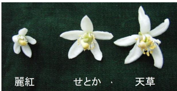
写真 2 「麗紅」, 「せとか」および「天草」の花器

カンキツの果実は子房が生長、肥大したものであり、その子房の大きさと着果の程度は密接な関係がある。伊東ら 9) は尾張系普通ウンシュウにおいて、子房が大きな果実ほど着果率が高いことを確認している。写真 2 に示すように「麗紅」は「せとか」や「天草」と比較し、花器が極めて小さい。このことが着果率の低下を招いているひとつの要因であると思われる。