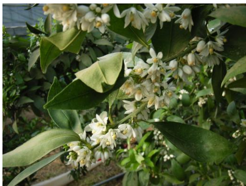
写真 3 「麗紅」における着花過多の状態

小野ら 14) は「吉田ネーブル」, 「鈴木ネーブル」, 「福原オレンジ」, 「清見」, 「ヒュウガナツ」, 「吉田ポンカン」および「川野なつだいだい」を供試し、直花と有葉花の着果率について調査した結果、品種や成り年、不成り年にかかわらず有葉花の着果率が高かったとしている。本試験においても表 2 に示すように「麗紅」, 「せとか」とも着花数は直花が多いものの、着果率は有葉花が高く、この点に関しては小野らの結果と一致した。しかしながら、両品種を比較した場合、「麗紅」は直花が極めて多く(表 2, 写真 3), その比率が高いことから、有葉花の着果率も低いことが考えられる。