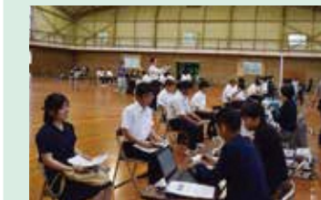
農業法人・企業説明会