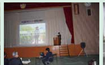
県プロジェクト発表会