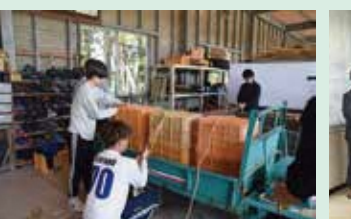
ロープワーク研修