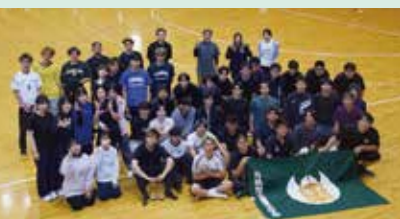
近県スポーツ交歓大会