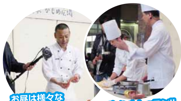
お昼は様々なプロの料理人によるワンポイントレッスン!!