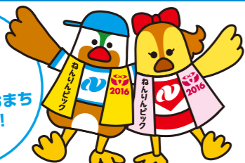
団長 がんばくん チアリーダー らんばちゃん 「ねんりんピック応援団」