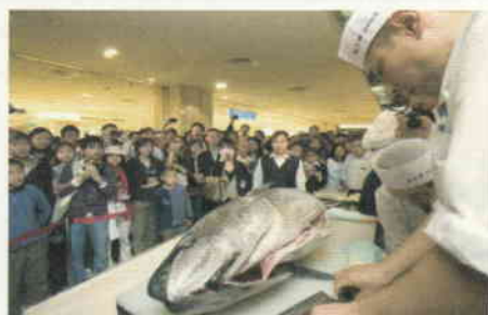
北京「長崎フェア」で注目を集めたマグロの解体ショー

期間中、約36,000人の方々にご来場いただき、本県の優れた県産品や観光などの魅力をPRしました。