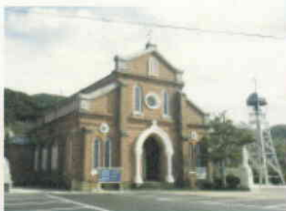
青砂ヶ浦天主堂 (新上五島町)