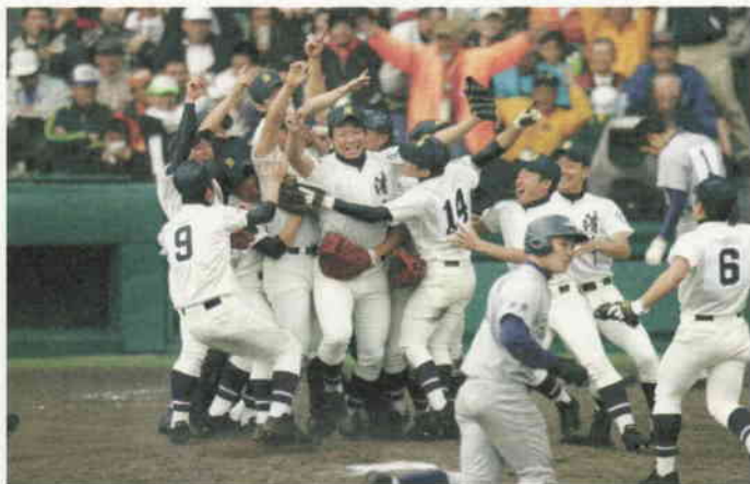
第81回選抜高校野球大会で初優勝を果たした清峰高校