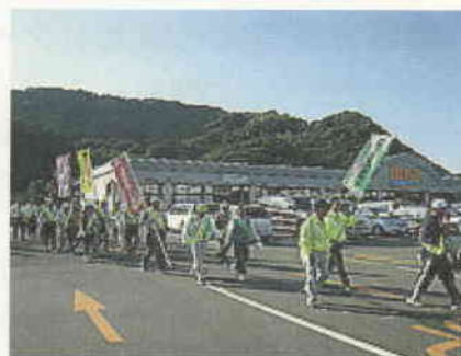
県内一斉防犯パトロール