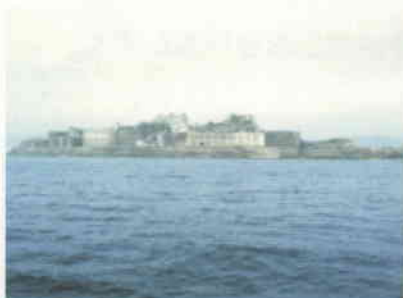
端島(軍艦島) (長崎市)