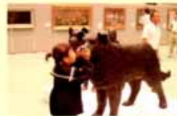
長崎美術館(長崎市出島町)