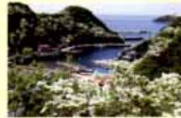
鱈浦集落(対馬市上対馬町)

皆さんからお寄せいただいた寄付金については、次のような県の事業に大切にに使わせていただきます。