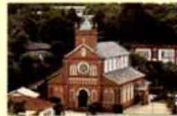
黒島天主堂(佐世保市黒島町)