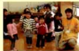
地域における親子交流の場