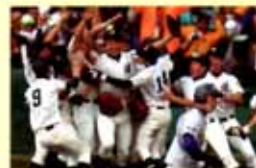
清峰高校野球部