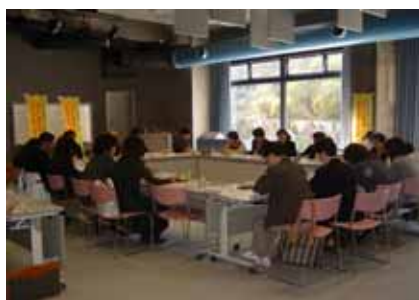
・県央地域ネットワーク会議