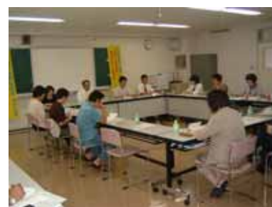
・五島地域ネットワーク会議