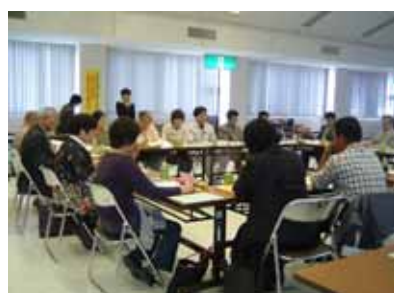
・対馬地域ネットワーク会議