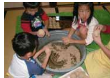
・平戸市立南部中学校のお魚料理教室の様子