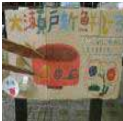
・瀬戸小学校の取り組み

私たちの町に大瀬戸食堂を作ろう ~大瀬戸ならではの自慢メニューを考え、地域の皆さんに紹介しよう~ 地域の歴史、特産物について調べ、地元ならではの新メニューを考えて実際に自分たちで調理し、地域の方々に食べていただくことで、子どもの食に関する関心と、地域の方々への感謝の気持ちを高めようという活動を行いました。子どもは自主的に魚のさばき方の練習などに取り組むなど活発に活動し、食に関する関心が大きく向上しました。