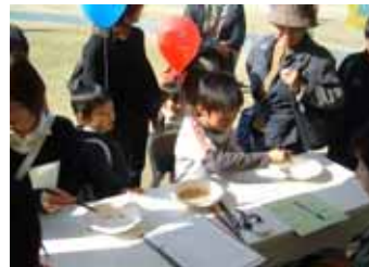
・ながさき実り・恵みの感謝祭「食育コーナー」の様子