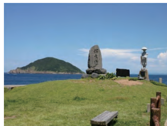
A 三井楽(みみらくのしま) 遣唐使船の日本最後の寄港地 となった場所です

7～8世紀、中国の進んだ制度や文化を学ぶために派遣された遣唐使船は、五島を日本で最後の寄港地としていました。真言宗を開いた空海、天台宗を開いた最澄も、遣唐使船に乗って五島から唐へ渡り、最新の仏教を学んで帰国しました。そのため、五島の各地には遣唐使ゆかりの史跡や伝説が残されています。遣唐使ゆかりの地である五島市には、日本遺産「『国境の島』吉岐・対馬・五島～古代からの架け橋～」の構成文化財が四つあります。