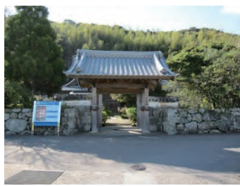
C 明星院本堂 五島で最も古い寺で、唐からの帰 りにこの寺にこもった空海が、明星庵 と名付けたと伝えられています。