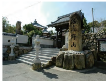
D 大宝寺 806年に遣唐使とともに中国に渡 った空海が、中国から帰る際に滞在 した寺院です。

※教会の写真掲載については、大司教区の許可をいただいています。