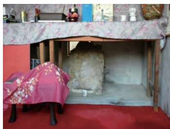
B ともづな石 遣唐使たちが港に入った際、とも 綱を結わえた石と言われています。 現在でも地元の人々の手によって、 大切に守られています。