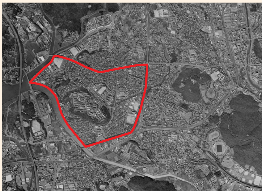
2006(平成18)年の西諫早ニュータウン