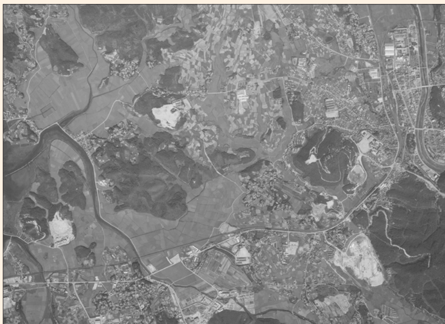
西諫早ニュータウン開発前の姿[1966(昭和41)年]