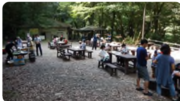
イベント会場の様子

また、子どもたちだけでなく、保護者の方も楽しんでいる様子が見られました。夏休みの工作課題を作りに来られた方々も、植物や自然と触れ合うことの楽しさを感じてもらえたのではないのでしょうか。今後も、毎年山の日イベントを開催することでより多くの方に森林の働きや良さを知ってもらえたらと思います。