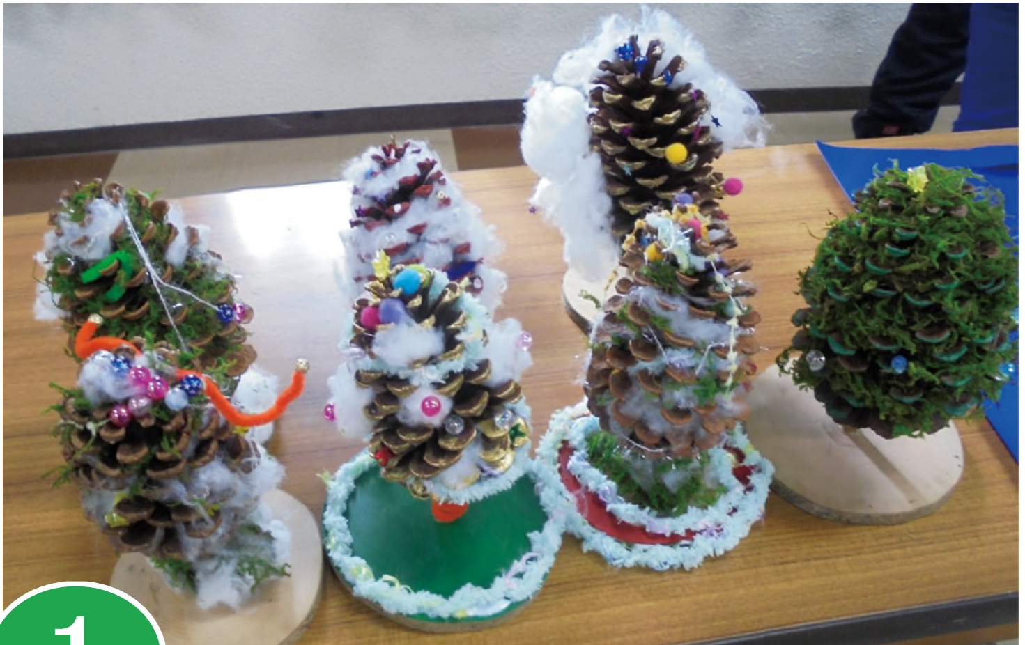
松ぼっくりでクリスマスツリーの制作（緑の少年団）