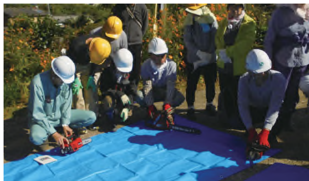
第三回技術研修会：チェーンソーのメンテナンス実習

内容：チェーンソーのメンテナンス実習、雑木林の除伐・間伐・整理伐の意味と目的の解説、除伐・整理伐の実習等