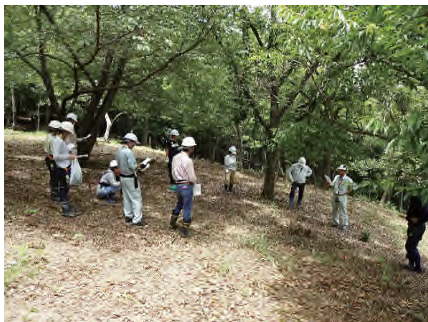
第二回技術研修会：活動地の林相についての解説

内容：里山づくりについての説明、ナタと鎌の研磨実技、活動地の林相についての解説、放置林の手入れ実習、現地調達材による道具「木かたげ又」の製作等