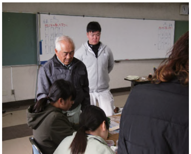
12月8日、9日 全県交流集会の様子

緑の少年団活動を有意義なものとしていくためには、保護者、小学校、緑の少年が連携しあって、緑の少年団活動が地域に定着していくことが、何より重要な要素であるようです。