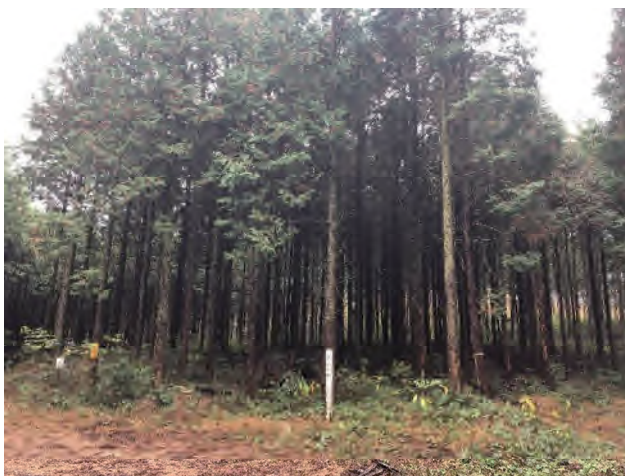
森林体験活動の場（ヒノキ人工林）

これまで佐世保市祇園緑の少年団や長与北緑の少年団なども体験学習のために受け入れており、他の緑の少年団との交流のきっかけにもなっているのです。