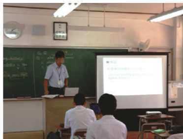
段階的に英文法を理解させる工夫