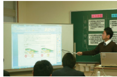
電子黒板を活用し視覚的に捉えやすくする工夫

○学校行事などにおいて、生徒が式次第を確認しやすいように大型スクリーンで示したり、会場設営を生徒が主体的にできるように各ブロックのいすの色を揃えたりするなどの具体的手立ての効果を検証する。