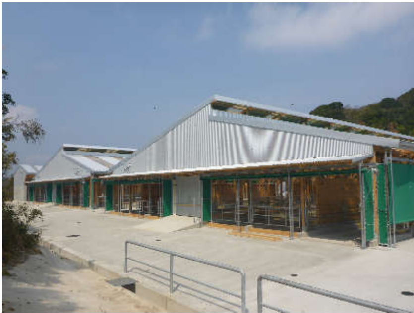
畜産クラスター構築事業による牛舎整備