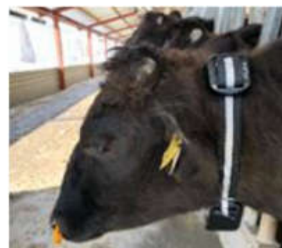
生体モニタリングシステム