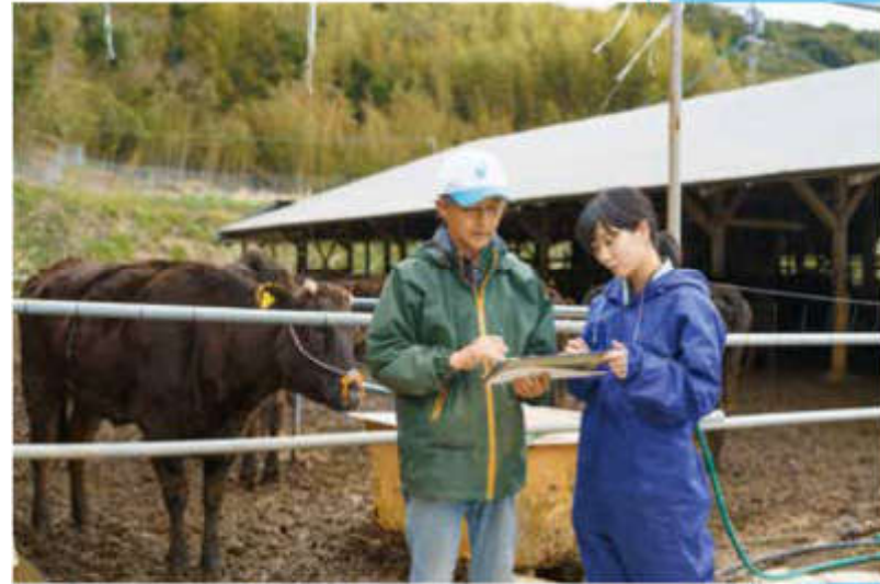
農家への経営指導

私は畜産の普及指導員として、主に畜産農家への技術や経営指導を行っています。大切にしているのは現場に足を運ぶこと。現場を見ることで、セリ（販売）成績データ等の数値を追うだけではわからないことが浮かび上がってくるからです。畜産農家の所得向上に向けて課題を明確にし、それぞれの経営規模に合った助言・指導を心がけています。