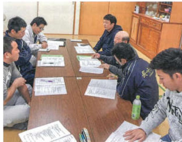
肉用牛ヘルパー組織の立上げ