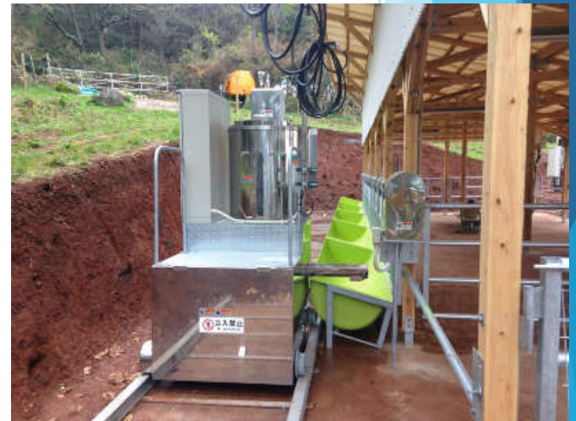
自動給餌機（遠隔制御）

5年に1度開催される和牛のオリンピックで日本一に輝き、近年ますます注目を浴びている長崎和牛をはじめ長崎県の畜産の魅力年全国的に広めるため、生産者や市町、農協などの関係機関と連携しながら品質や生産性の向上に取り組んでいます。私の主な担当は牛のエサとなる自給飼料の利用拡大。効率よく栽培できる優良品種が普及すれば、輸入飼料に依存せずすみませす。効率的な自給飼料生産により、長崎和牛の安定的な生産拡大を目指しています。