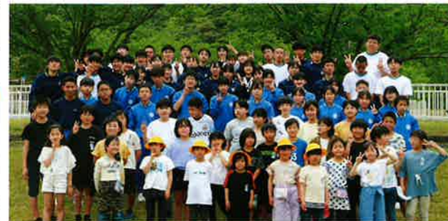
●小中高合同歓迎遠足(4月)