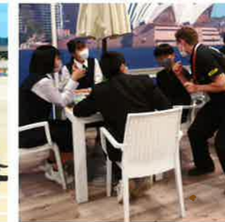
●海外語学研修修学旅行(12月)