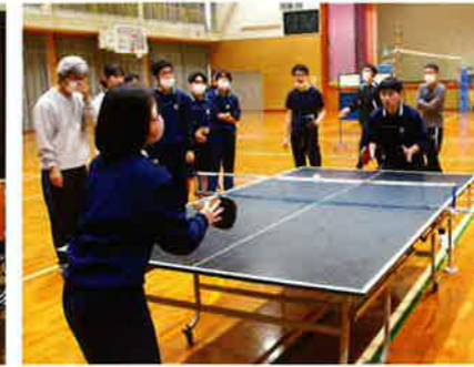
●校内球技大会(7月・3月)