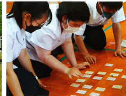
●小中高合同かるた・百人一首大会(6月)