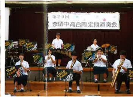
●吹奏楽部定期演奏会(7月)