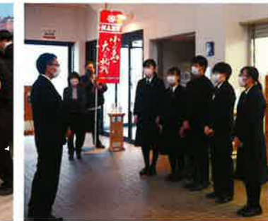
●大学入学共通テスト(1月)