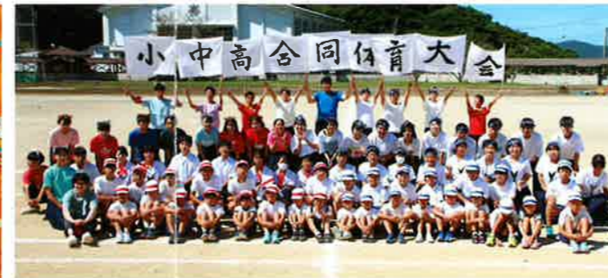
●小中高公民館合同体育大会(9月)