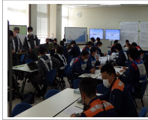
現地調整所の活動 (島原復興アリーナ)