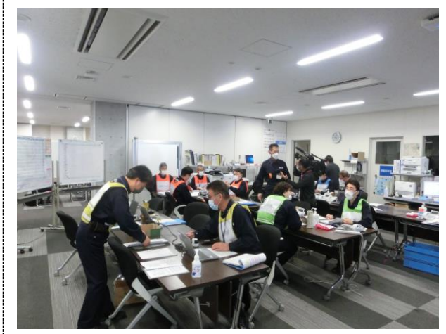
対策本部の活動 (長崎県)