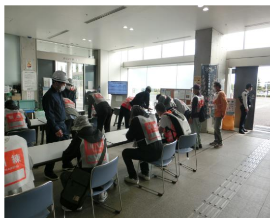
住民避難受付 (島原復興アリーナ)