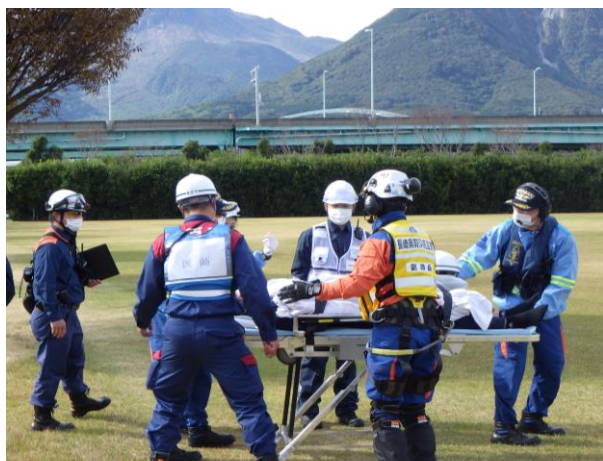
要配慮者避難：病院 (島原復興アリーナ)