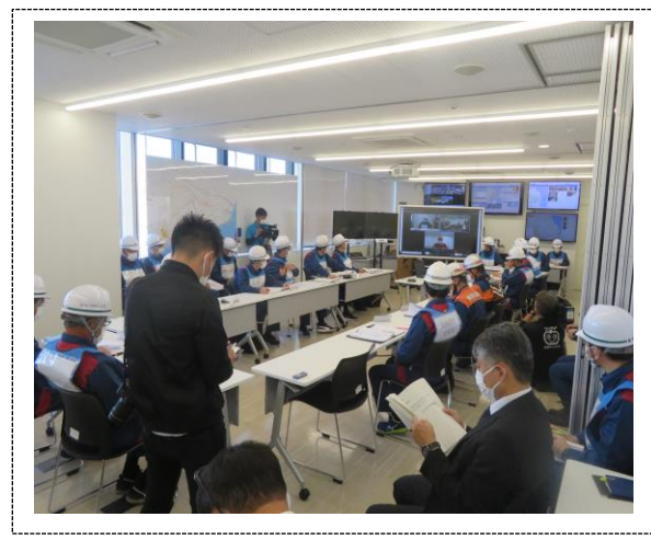
対策本部の活動 (島原市)