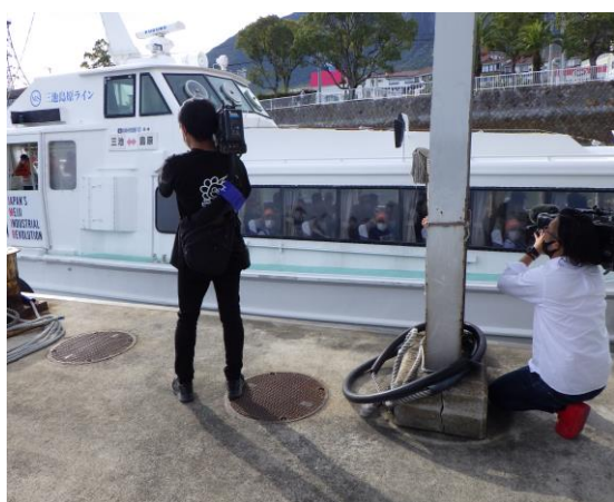
民間フェリー避難 (島原港)