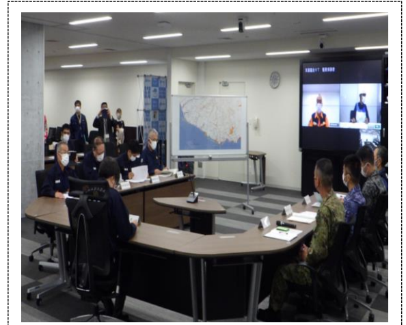
合同対策協議会 (長崎県、島原市、消防庁)