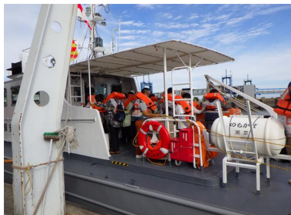
海保巡視艇避難 (島原港)