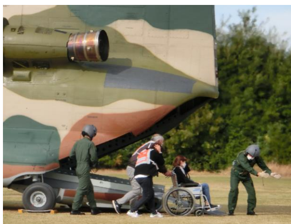
空自ヘリ搬送 (島原復興アリーナ)