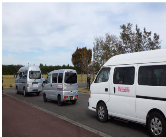
要配慮者避難：在宅、福祉施設 (島原復興アリーナ)